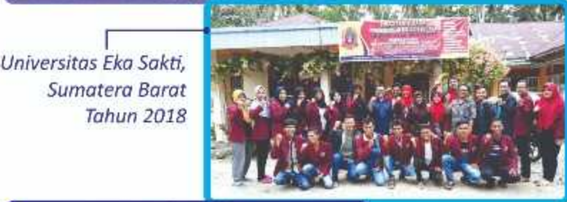
Universitas Eka Sakti, Sumatera Barat Tahun 2018