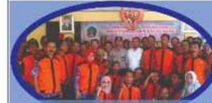
Universitas Jendral Soedirman