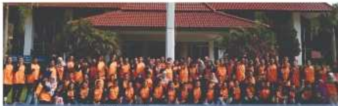
UPN Veteran Yogyakarta