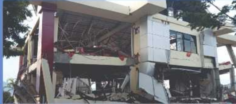
Dampak Gempa Palu 2018 pada Infrastruktur Perguruan Tinggi: Universitas Tadulako, Palu