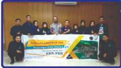
Universitas Sebelas Maret, Jawa Tengah Tahun 2018