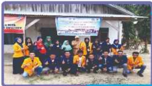
Universitas Halu Oleo, Sulawesi Tenggara Tahun 2018