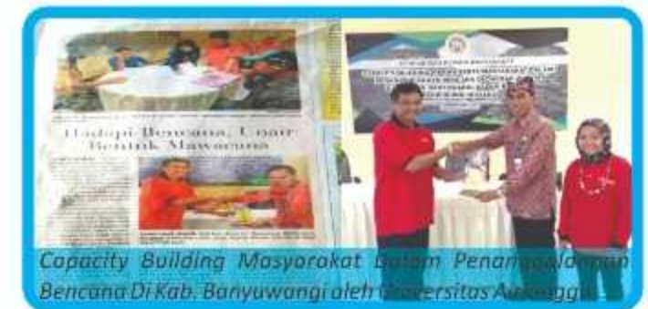
Capacity Building Masyarakat Dalam Penanggulangan Bencana Di Kab. Banyuwangi oleh Universitas Airlangga