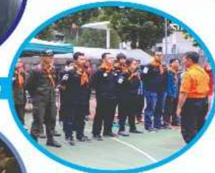
UPN Veteran Yogyakarta