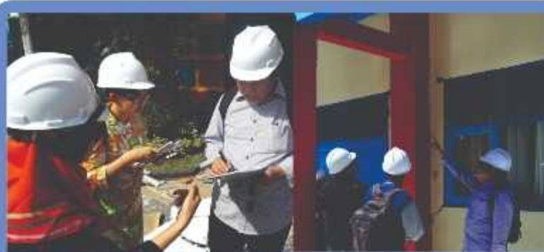
Inspeksi bangunan pasca gempa Lombok oleh Insitut Teknologi Bandung dan Universitas Mataram, Tahun 2018